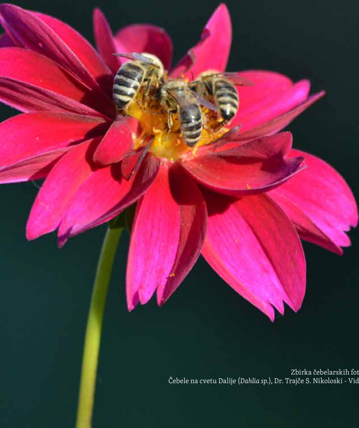
Zbirka čebelarskih fotografij Čebele na cvetu Dalije ( Dahlia sp.), Dr. Trajče S. Nikoloski - Vidranski